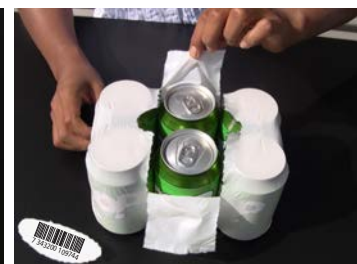
Abrissperforation & Aufriss