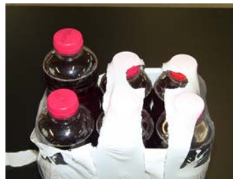
PET-Flaschen – einfaches Öffnen mit Gebindestabilität