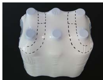
Aufrissperforation – einfaches Öffnen

Für weitere Informationen kontaktieren Sie uns bitte direkt oder besuchen Sie uns auf www.burckhardt.com