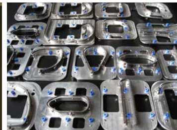
Flexibles Design von Werkzeugen

Für weitere Informationen kontaktieren Sie uns bitte direkt oder besuchen Sie uns auf www.burckhardt.com